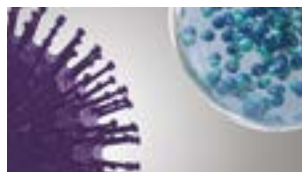
nanoe™ X når föroreningarna.

Tack vare egenskaperna i nanoe™ X kan flera typer av föroreningar inaktiveras, däribland vissa bakterier, virus, mögel, allergener, pollen och skadliga ämnen.