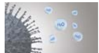
Föroreningarnas aktivitet hämmas.